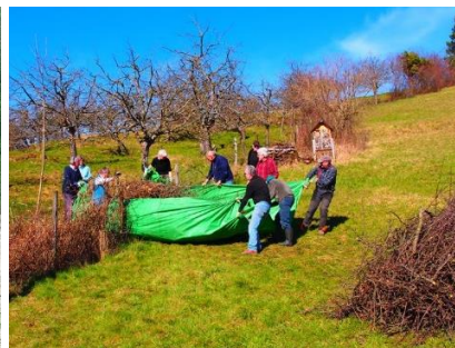
in der Altägerte