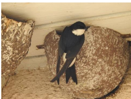
Mehlschwalben sind in Magden wohlauf

Das Vogeljahr 2020 war von einem besonders erfreulichen Ereignis geprägt: zum ersten Mal hat das Schwarzkehlchen in Magden gebrütet! Über dieses Highlight haben wir in der Magdener Dorfzeitung berichtet. Die Brut fand in einer Buntbrache oberhalb der Altägerte statt und zeigt, wie wichtig und bedeutsam Ausgleichsmassnahmen im Landwirtschaftsgebiet sind. Im Frühling wurde zudem ein Wiedehopf in der Altägerte gesichtet, allerdings ist er dann weitergezogen. Wir hoffen immer noch, dass der Wiedehopf dereinst wieder in Magden brütet und von einer unserer Nisthilfen Gebrauch macht.