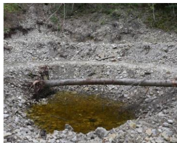
Weiher Unter de Felse