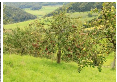
Arboretum in der Altägerte