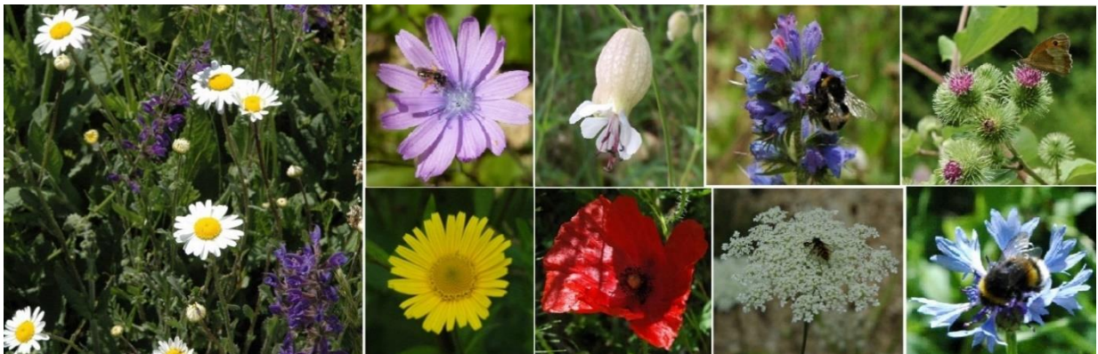
Blumengruss 2020 aus der Dellgrube - vor zwei Jahren wurden an Arbeitseinsätzen Wildblumensaatgut in der Dellgrube ausgesät.

Im neuen Jahr versuchen wir wieder ein vielfältiges Programm anzubieten, werden wie gewohnt unsere Schutzgebiete pflegen und möchten ein neues Projekt entwickeln. Dazu sind wir erneut auf Ihre Hilfe angewiesen. Wir möchten an dieser Stelle allen Helferinnen und Helfer, Gönnerinnen und Gönner für ihren grossen Einsatz und ihre Unterstützung ganz herzlich danken! Wir wünschen Ihnen spannende Begegnungen mit der Natur, gute Gesundheit und viel Freude im Jahr 2021!