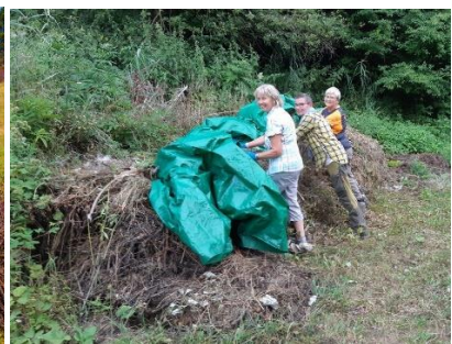
und in der Dellgrube