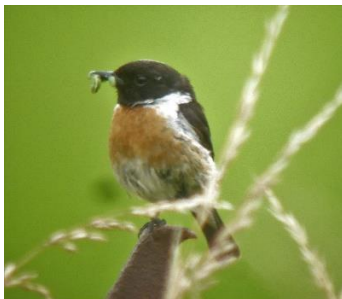
Schwarzkehlchen Männchen - 1. Brutnachweis in Magden