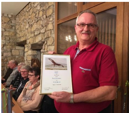
32 Jahre im Vorstand

«Du bist nicht mehr da, wo du warst, aber du bist überall wo wir sind.»