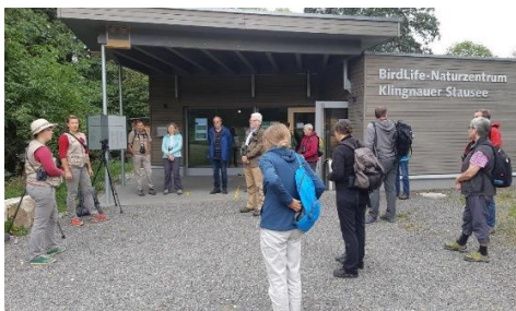
Besuch BirdLife-Naturzentrum Klingnauerstausee